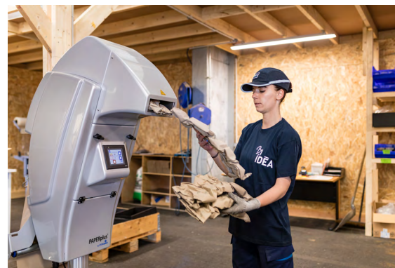
Emballage de petites pièces de rechange

IDEA a réalisé des investissements lourds afin d'accompagner au mieux MAN Energy Solutions au quotidien : aménagement d'une zone dédiée à cette nouvelle activité, extension des bureaux pour intégrer une partie administrative plus importante (pilotage d'activité, SAP, coordination des transporteurs) et recrutement de nouveaux collaborateurs.