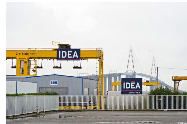
Site des profilés