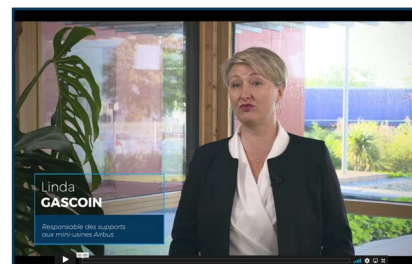
Les clients d'IDEA témoignent