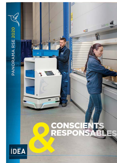
Panorama RSE

« La crise actuelle, liée à la Covid-19, nous interroge tous sur la société que nous souhaitons pour demain, pour nos enfants, sur ce que nous voulons réussir ensemble et sur notre contribution. Cette réflexion, nous l'avons dans notre vie privée, comme dans notre vie professionnelle. Et nous partageons tous l'engagement de vouloir faire mieux pour nos clients, nos collaborateurs et notre environnement. C'est à mon sens le fruit de notre travail collectif sur la raison d'être. Croire en ce que l'on fait, comprendre pourquoi on le fait et y trouver un sens personnel, c'est extrêmement motivant.»