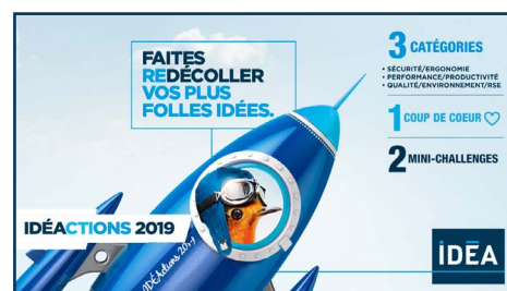
Les gagnants IDÉACTIONS 2019

60 % du parc de la branche transport du groupe a été renouvelé avec des poids lourds euro 6